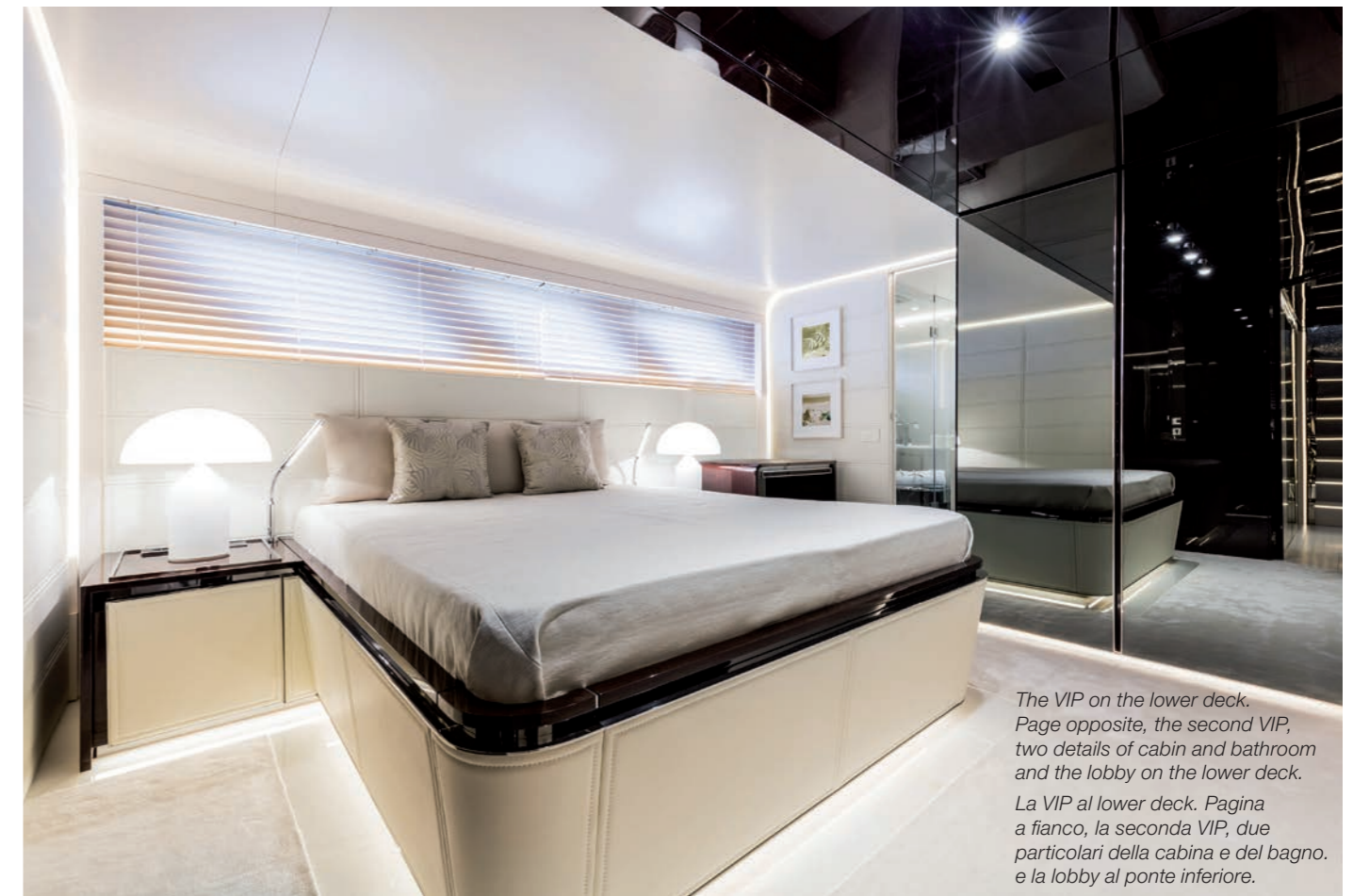
The VIP on the lower deck. Page opposite, the second VIP, two details of cabin and bathroom and the lobby on the lower deck. La VIP al lower deck. Pagina a fianco, la seconda VIP, due particolari della cabina e del bagno. e la lobby al ponte inferiore.

Uno spazio questo che si sviluppa nella parte prodiera del main deck che, altro dato che sottolinea la vivibilità del DL Dreamline 34M, dal living nel pozzetto prosegue per tutta la sua lunghezza mantenendo il medesimo livello del piano di calpestio. La suite armatoriale ha poi altri due elementi che caratterizzano il layout esterno e inter-